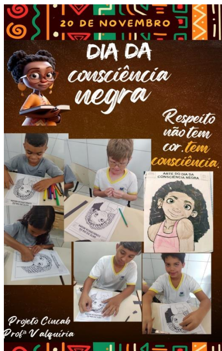
ATIVIDADE: CONSCIÊNCIA NEGRA