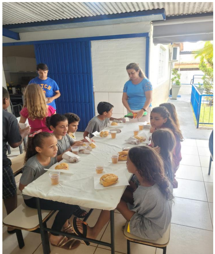
CELEBRAÇÃO ANIVERSARIANTES DO MÊS