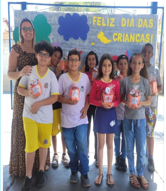
COMEMORAÇÃO DIA DAS CRIANÇAS