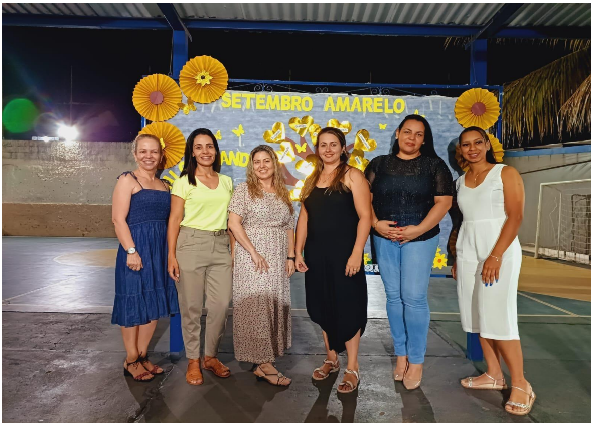
SETEMBRO AMARELO: Reunião SCFV