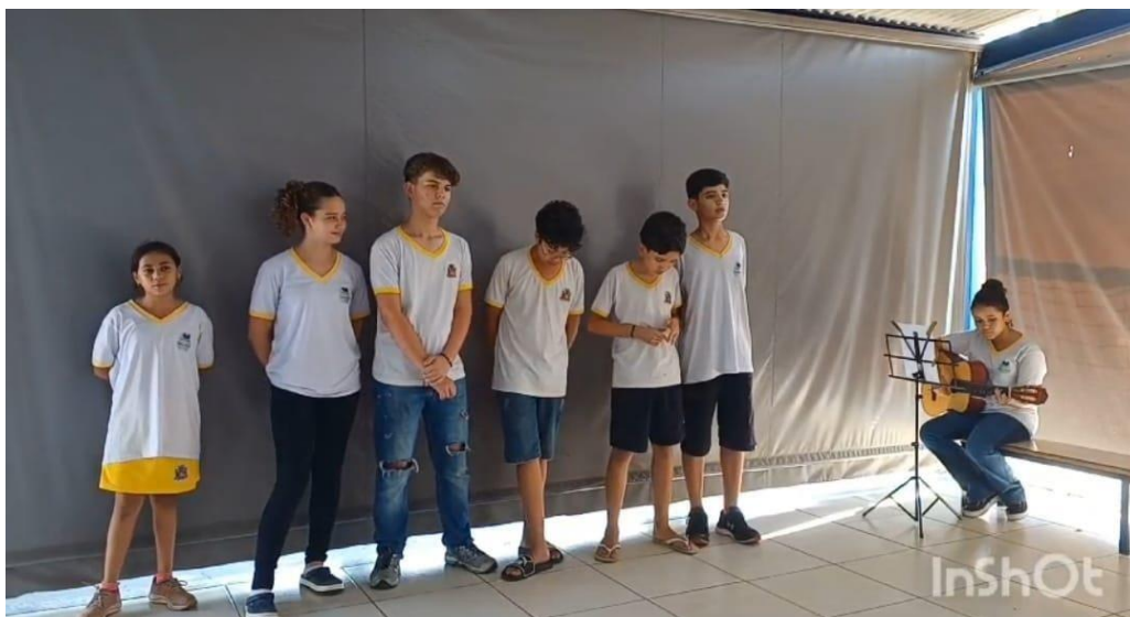
TEATRO MUSICAL: SETEMBRO AMARELO “Pela Valorização da Vida”