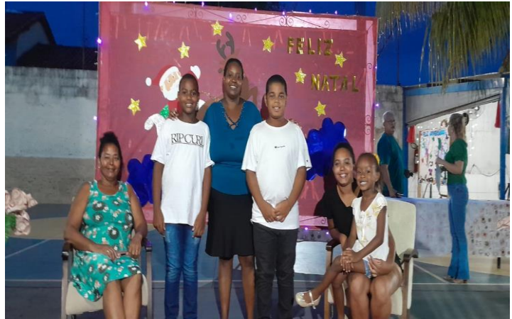
Homenagem e premiação as frases Vendedoras Campanha Contra o Abuso Sexual De Crianças e Adolescentes