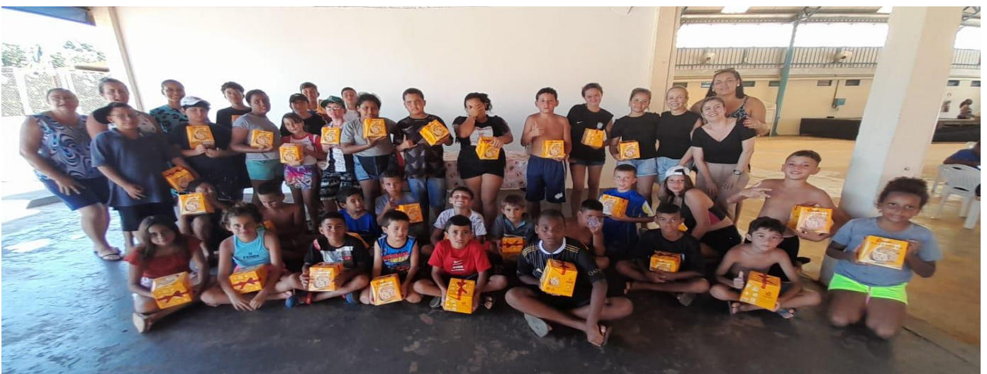
Festa Confraternização Clube Santa Isabel