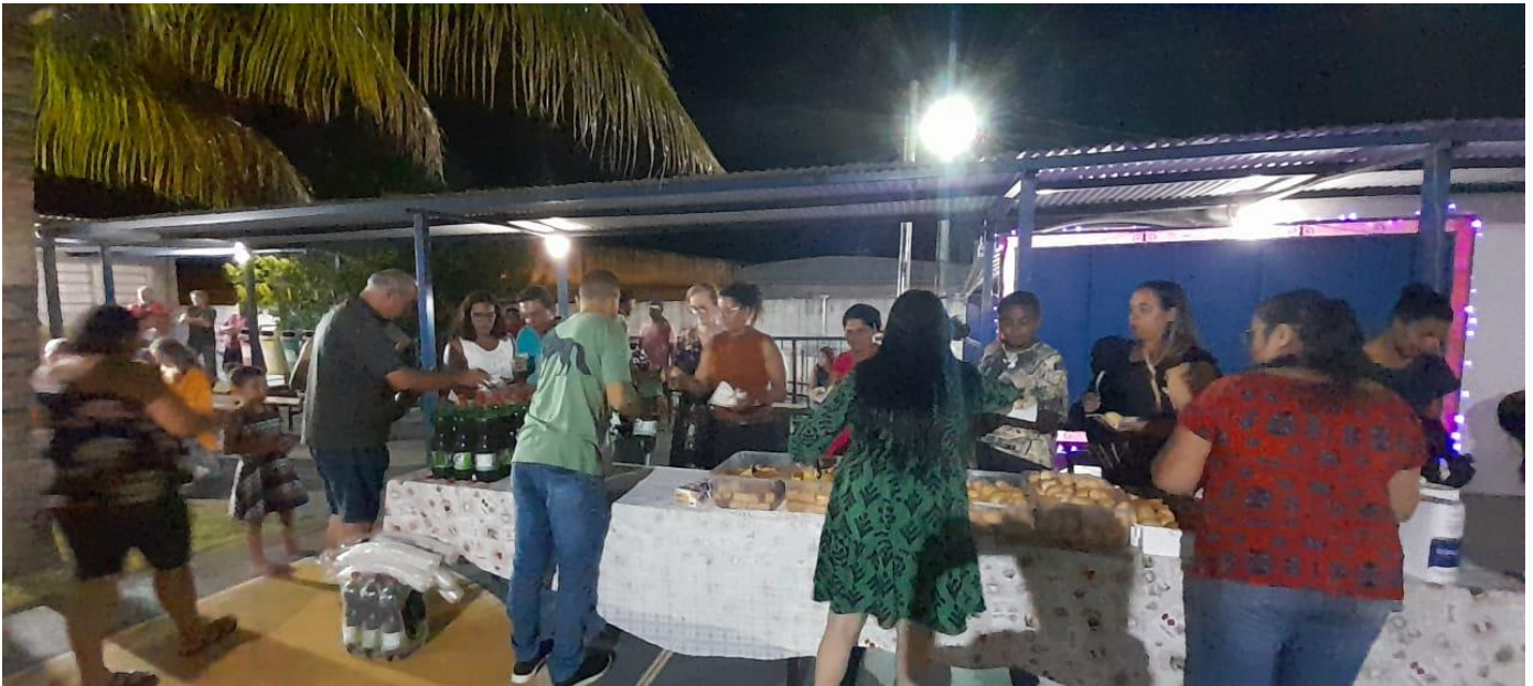
Confraternização com usuários e suas famílias