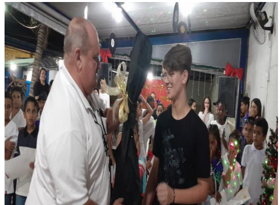
Premiação Oficina de Música