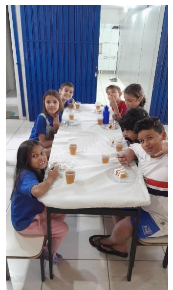
Comemoração aniversariantes do Mês