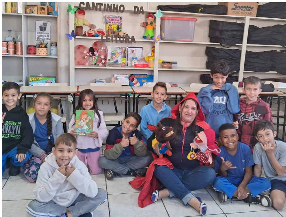
Cantinho da Leitura